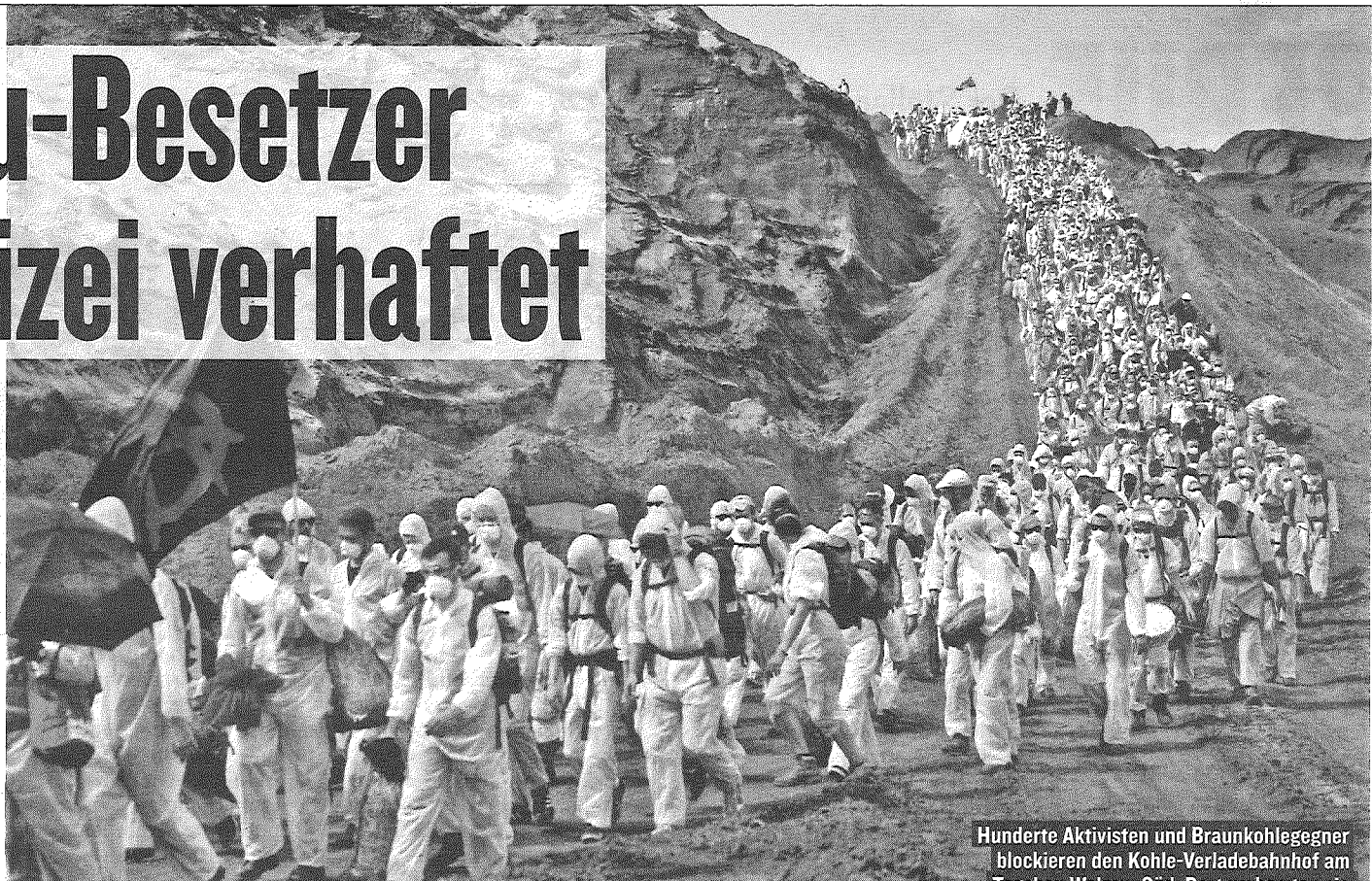
Hunderte Aktivisten und Braunkohlegegner blockieren den Kohle-Verladebahnhof am Tagebau Welzow-Süd. Dort verharrten sie die Nacht zum Sonnabend, zeigten sogar Kunststücke (unten).